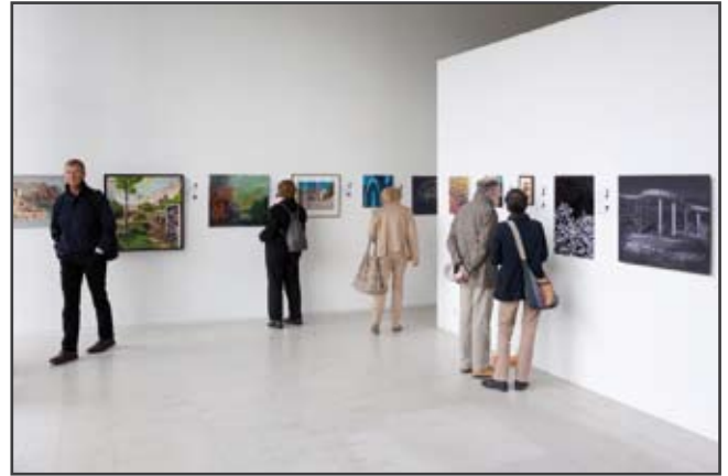
Der gutbesuchte Auktionsraum zur Nacht der Kunst 2015