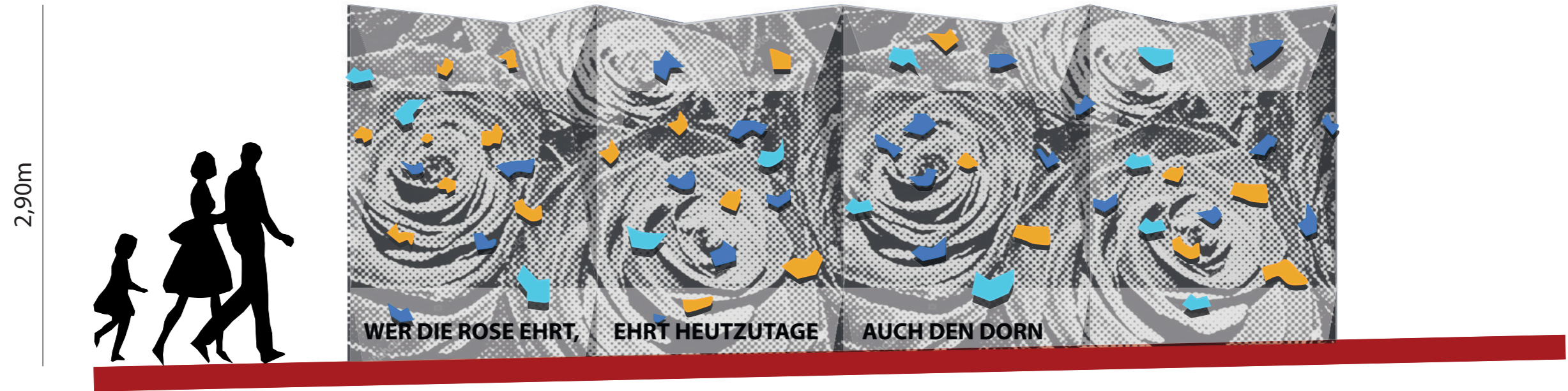
Beispiel 1: Wer dir Rose ehrt (Renft)